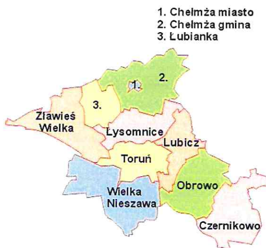
Rysunek 1. Powiat Toruński

Gmina Łubianka zajmuje powierzchnię 84,6 km 2 i położona jest w północno-zachodniej części powiatu toruńskiego. Jednostka stanowi 0,5% powierzchni powiatu. Według danych z 2018 ludność Gminy wynosi 7 133 mieszkańców, a gęstość zaludnienia to w przybliżeniu 84 osób/km 2 . W skład Gminy wchodzi 12 sołectw. Gmina Łubianka sąsiaduje z następującymi gminami: Unisław, Kijewo Królewskie, Chełmża, Łysomnice, Zławieś Wielka.